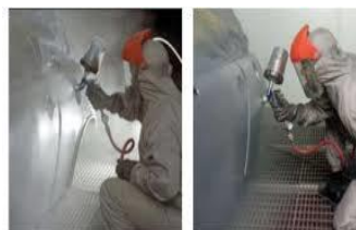
Figure 1 Now you see it