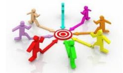
Gruppo lavoro anticorruzione

Il sistema organizzativo per la prevenzione della corruzione e per la trasparenza