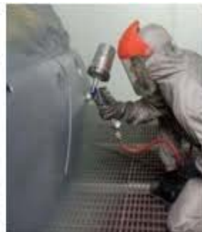
Figure 2 Now you don't